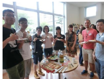
▲ウェルカムパーティ