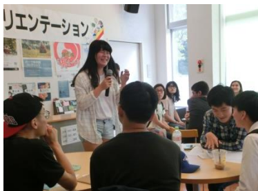
▲オリエンテーション